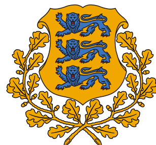
Государственные флаг и герб Эстонской Республики

Государство в северо-восточной Европе. Эстония делится на 15 уездов (маакондов) подразделяющихся на 241 муниципалитет двух типов: города и волости.