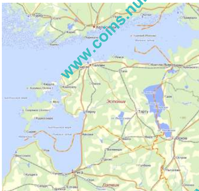
Карта Эстонской Республики

Эстония располагает густой речной сетью. Самая длинная река - Пярну имеет протяжённость 144 км. Наиболее многоводные реки - Нарва и Эмайыги. В Эстонии насчитывается более 1150 озёр и свыше 260 искусственных прудов. Крупнейшее озеро страны Чудское (или Пейпси) расположено на востоке и образует природную границу с Россией. Площадь Чудского озера 3555 км 2 , из них 1616 км 2 принадлежат Эстонии. Самый крупный внутренний водоём Эстонии - озеро Выртсъярв (266 км 2 ).