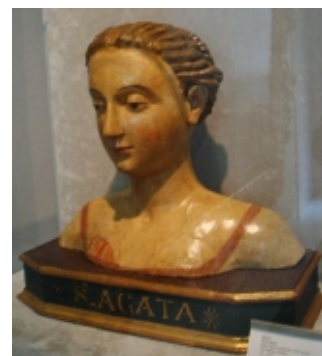
Святая Агата, XVI век, дерево

На реверсе монеты 50 евро изображён фрагмент картины «Святой Марино», выполненной неизвестным художником XVI века. Святой Марино - христианин-каменотёс, основавший в 301 году на горе Титано христианскую общину, ставшую основой будущей Республики Сан-Марино.