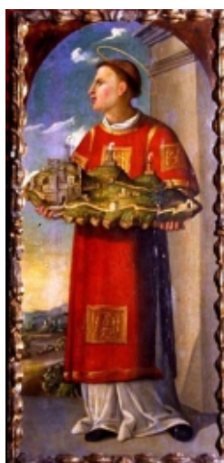
Картина «Святой Марино», XVI век, темпера

Государственный музей Сан-Марино расположен во дворце Бергами-Белуцци и является крупнейшим музеем республики. В его экспозиции, посвящённой истории Сан-Марино, насчитывается около 5000 экспонатов. Один из залов музея посвящён святым покровителям Сан-Марино, благодаря которым республика на протяжении веков сохраняла свою независимость: основателю Сан-Марино - Святому Марино и Святой Агате.