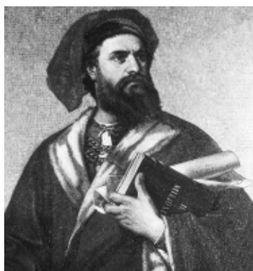
Марко Поло, мозаика XVIII века

Марко Поло (итал. Marco Polo , 15.09.1254 - 8.01.1324 гг.) - итальянский купец и путешественник, представивший историю своего путешествия по Азии в своей знаменитой книге «Книга о разнообразии мира».