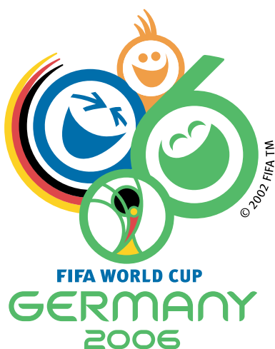
Эмблема 18-го чемпионата мира по футболу 2006 года

Всего в финальной стадии чемпионата было сыграно 64 матча и забито 147 голов. Лучшим игроком чемпионата был признан игрок сборной Франции Зинедин Зидан.