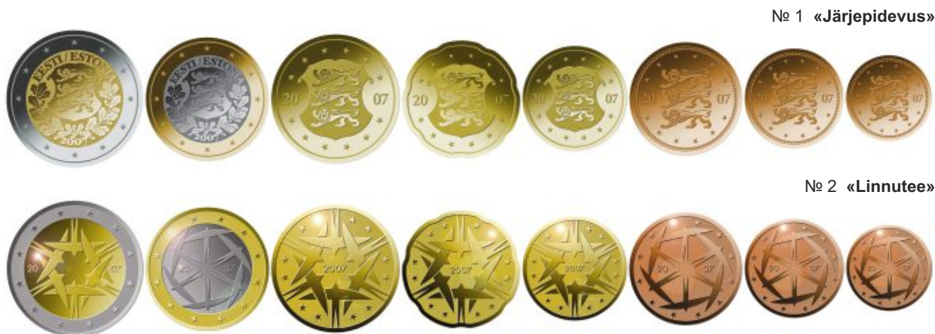
Таблица 2. Проекты оформления национальной стороны монет евро Эстонской Республики

Несмотря на то, что в голосовании приняло участие всего около 3,5% населения Эстонии, и художественное оформление победившего проекта в последствии вызвало неоднозначную реакцию в основном из-за отсутствия в оформлении каких-либо элементов культурной самобытности Эстонии, Банк Эстонии не стал пересматривать результаты голосования и 20 июля 2010 года на монетном дворе Финляндии началась чеканка новых монет евро Эстонии по утверждённому проекту.