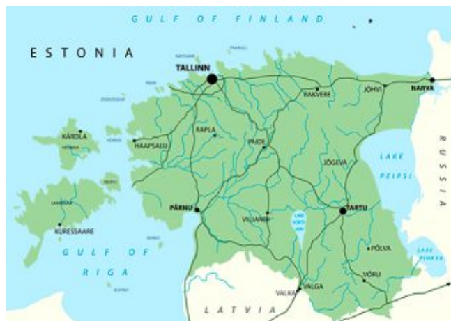
Карта Эстонской Республики

Площадь Эстонии - 45227 км 2 , в том числе: суша - 43211 км 2 , вода - 2016 км 2 . В состав Эстонии входит 1521 остров в акватории Балтийского моря общей площадью 4,2 тыс. км 2 . Самые крупные из них: Сааремаа (2673 км 2 ) и Хийумаа (1023 км 2 ). Государство расположено в пределах Восточно-Европейской равнины. Основную поверхность составляет низменная холмистая и болотистая местность. Средние высоты поверхности - 50 м над уровнем моря. Самая высокая точка - гора Суур-Мунамяги (318 м) расположена на юго-востоке. Эстония располагает густой речной сетью. Самая длинная река - Пярну имеет протяжённость 144 км. Наиболее многоводные реки - Нарва и Эмайыги. В Эстонии насчитывается более 1150 озёр и свыше 250 искусственных прудов. Крупнейшее озеро страны Чудское (или Пейпси) расположено на востоке и образует природную границу с Россией. Площадь Чудского озера 3555 км 2 , из них 1616 км 2 принадлежат Эстонии. Самый крупный внутренний водоём Эстонии - озеро Выртсъярв (266 км 2 ).